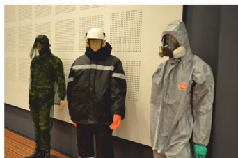
Техносферная безопасность сегодня — стр. 10