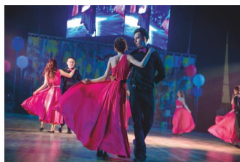
Алхимия — стр. 7