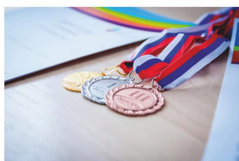
Спортивный СГУГИТ — стр. 14