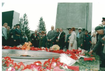
В преддверии Дня Победы — стр. 5