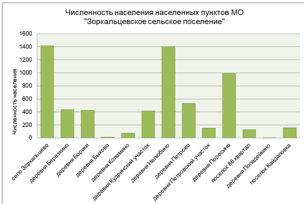
Рис. 1. Состав МО «Зоркальцевское сельское поселение»