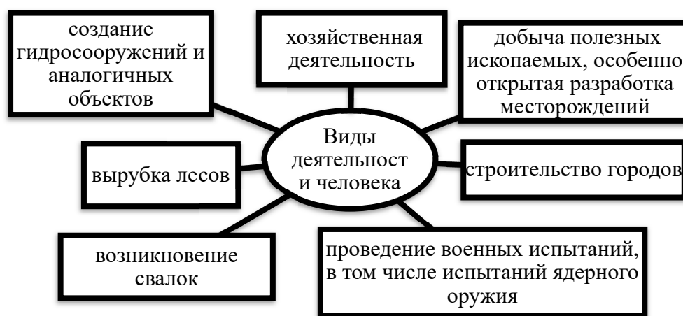
Рис. 1. Виды деятельности человека

На рис. 1 представлены виды деятельности человека, в ходе которых возникает необходимость выполнения рекультивации земель и водных объектов.