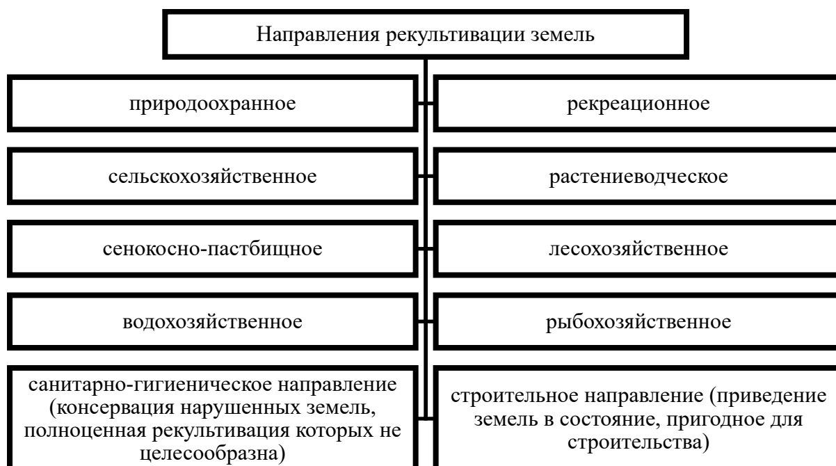
Рис. 3. Направления рекультивации земель

На рис. 3 представлены направления рекультивации земель [9], они выбираются согласно тем целям, которые были установлены при рекультивации земель.