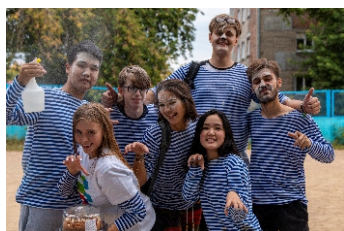
Ежегодный краш-тест первокурсников - стр.4