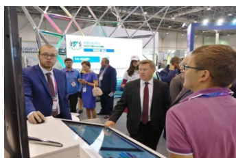
Вперед в будущее - стр. 6