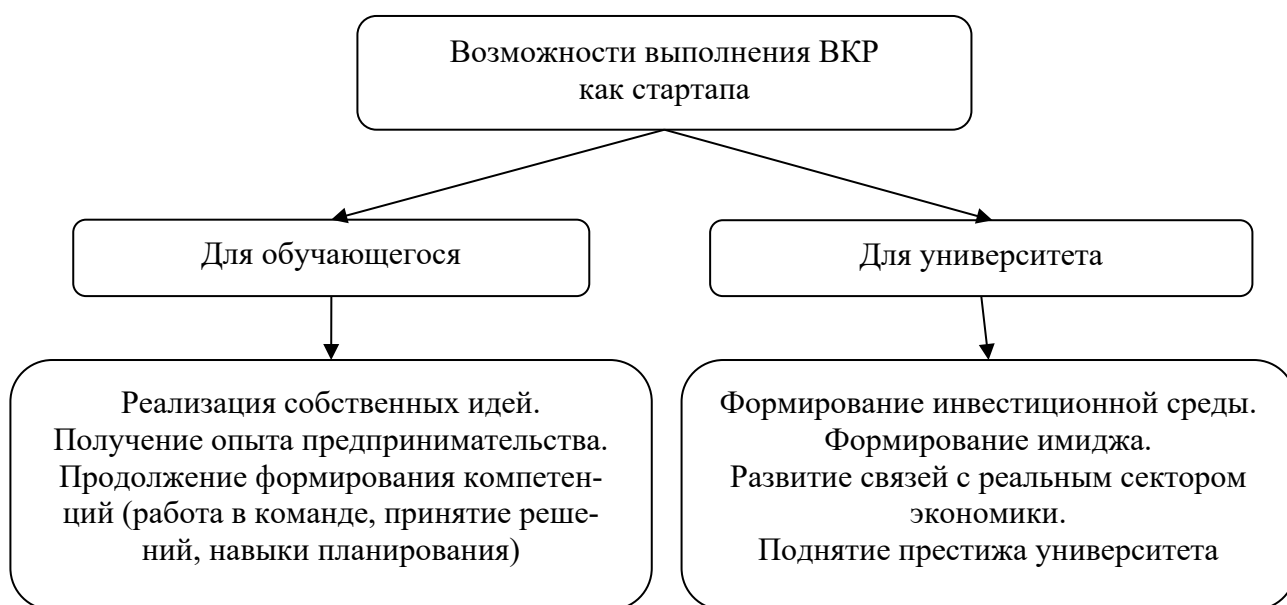
Рис. 1. Возможности нового формата выполнения ВКР

Для реализации инновационного потенциала университета в полной мере необходимо наличие организационно-деловой инфраструктуры, которая позволит поддерживать проекты студентов. Наличие научно-исследовательских студенческих проектов и перенесение их в коммерческую среду формирует положительные аспекты работы не только для обучающегося, но и для университета (рис. 1).