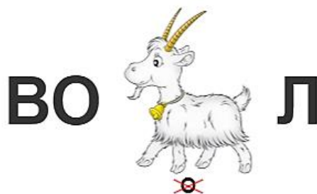
Рис. 1. Определение названия стихотворения

Задание 1. Решите ребус и определите название стихотворения.