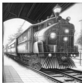
Рис. 2. Железная дорога

Интересными оказались предложенные студентами заголовки стихотворения (« Железная дорога », « Городской вокзал », « Стальные магистрали », « Воспоминания монтера пути »), а также сделанные ими иллюстрации (рис. 2-5). Все иллюстрации сделаны при помощи программы Kandinsky 2.1. URL: https://rudalle.ru/kandinsky2 .