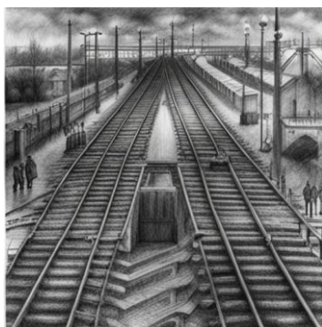
Рис. 4. Стальные магистрали