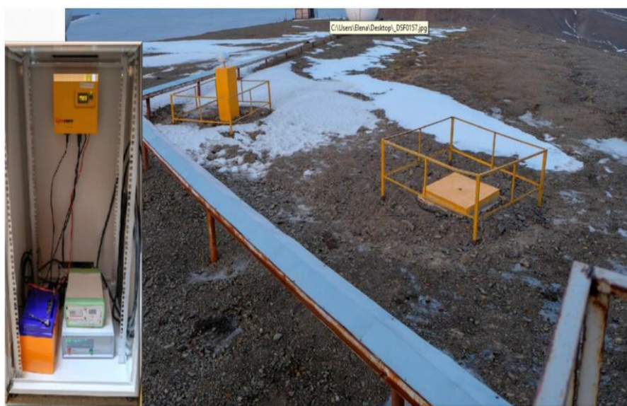
Рис. 1. Пункт ФАГС Баренцбург [11]

Пункт ФАГС Баренцбург (BARE), расположенный на архипелаге Шпицберген (Норвегия, демилитаризованная зона), рис.1, является самым северным пунктом фундаментальной астрономо-геодезической сети (78 0 с.ш.), где с октября 2018 года выполняются постоянные ГНСС-измерения по наблюдениям спутников GPS и ГЛОНАСС.