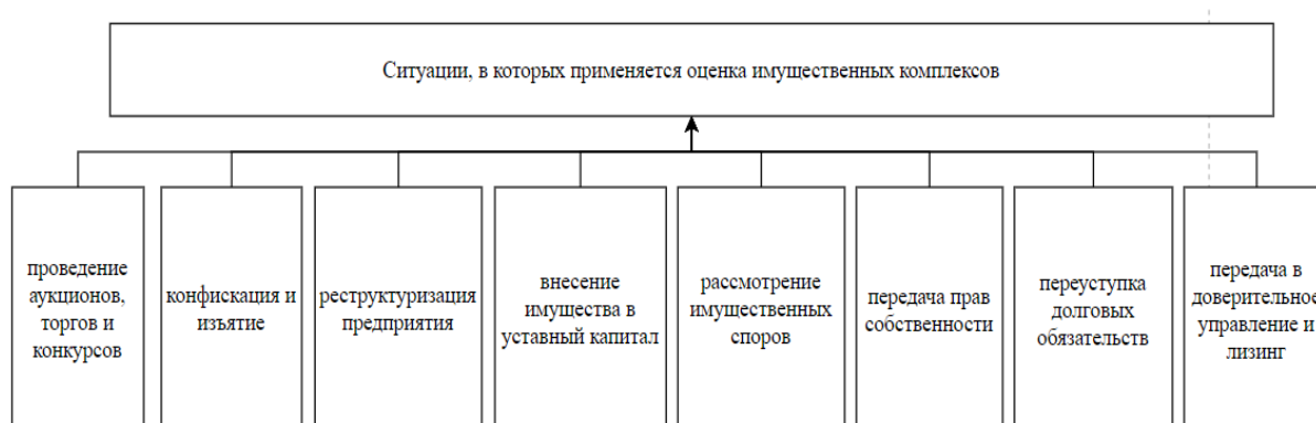
Рис. 1. Ситуации, в которых необходима оценка имущественных комплексов

Самой объемной, затратной и долгой услугой оценщика является оценка имущественных комплексов. А происходит это, потому что в нее входит оценка не одного объекта, а совокупность объектов, которые являются собственностью какого-то лица в целях предпринимательской деятельности. Данная процедура является обязательной и состоит из определения денежного выражения совокупности правовых, недвижимых и движимых объектов, которые находятся на балансе юридического лица и задействованы в предпринимательской деятельности [1]. В каких ситуациях применяется данная процедура представлено на рис. 1.