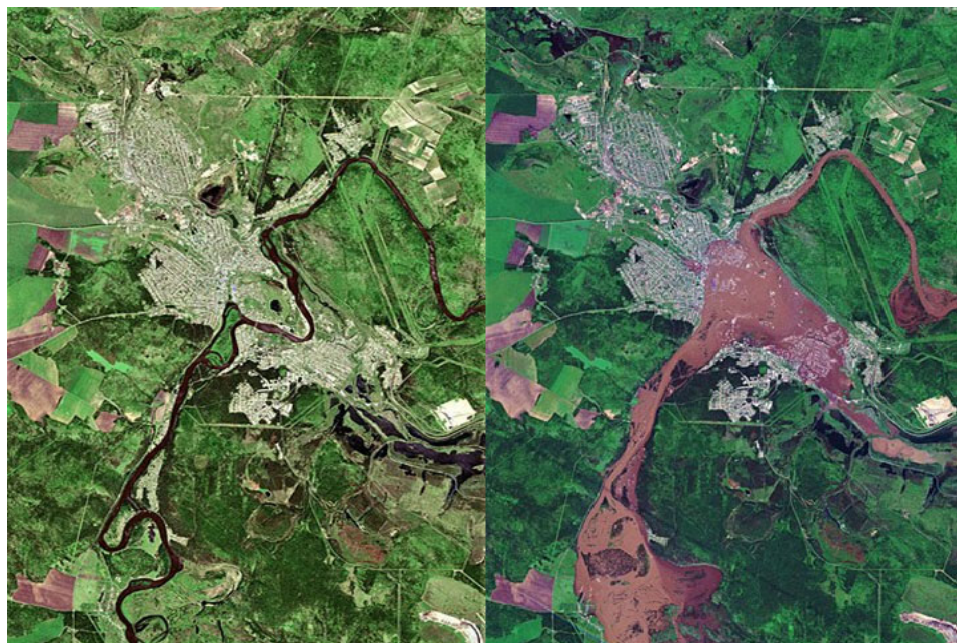
Рис. 3. Зона затопления города Тулун и окрестностей, полученная со спутника Sentinel-2

Одной из особенностей ЦИК ИХК будет отображение на них зон с особыми условиями использования территорий, характерных для региона, например, паводковая зона затопления в городе Тулун (рис. 3) и МО, расположенных в районе реки Ия. Отображение таких зон на ЦИК ИХК позволит проводить графоаналитические исследования для детального изучения в комплексе с другими картами (геологическими, гидрологическими, гидрогеологическими и др.).