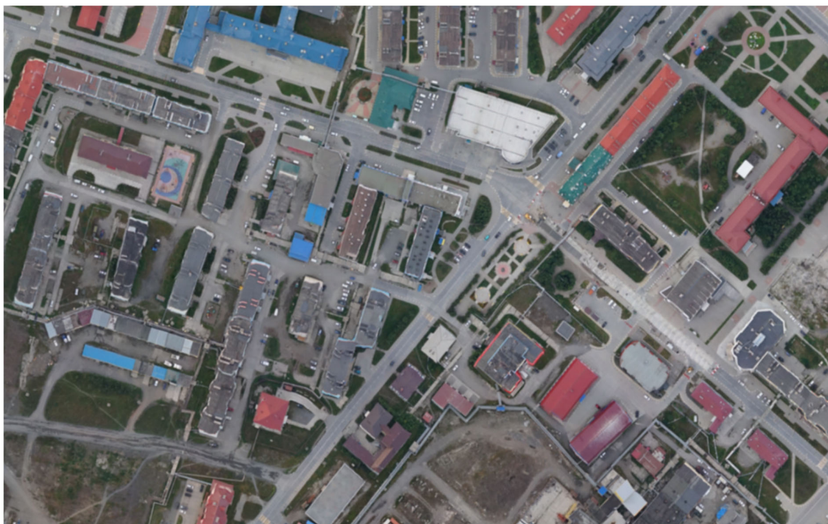
Рис. 2. Цифровой ортофотоплан в масштабе 1:2000

Содержание работ по созданию ЦОФП для формирования единой электронной картографической основы ЦИК ИХК крупного масштаба включает следующие основные виды работ: