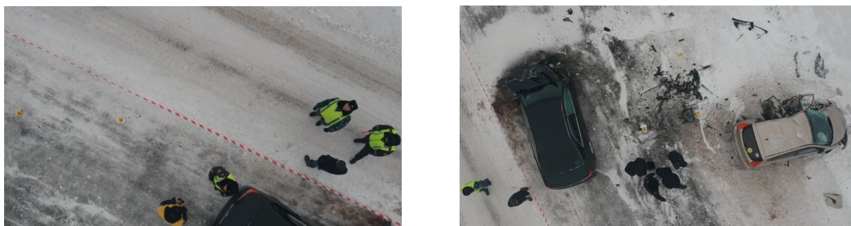
Рис. 2. Съемка с БПЛА с использованием масштабной ленты

Одним из видов съемки с БПЛА является использование масштабной ленты (рис. 2).