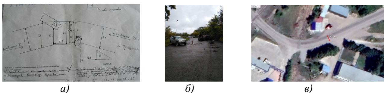
Рис. 1. Отображение места дорожно-транспортного происшествия в виде:

На рис. 1 представлено отображение места дорожно-транспортного происшествия в виде схемы ДТП, фотографии и размерной схемы ГИС «Спутник».