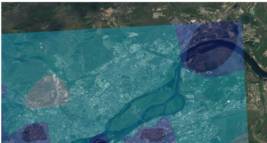
Рис. 3. Территория распространения вредных веществ (воздушных мигрантов) вблизи города Красноярска [5]

В Красноярском крае часть земельных территорий, используемых для сельскохозяйственного производства, находится в зоне влияния промышленных предприятий. Самыми крупными «поставщиками» различных загрязнителей в воздушный бассейн являются металлургические и энергетические предприятия, химическое производство, стройиндустрия, машиностроение. Один только Красноярский алюминиевый завод, располагающийся в черте города Красноярска, выбрасывает в окружающую среду целую гамму опасных веществ. Выбросы завода могут распространяться на большие расстояния, затрагивая не только город, но и его окрестности (рис. 3).