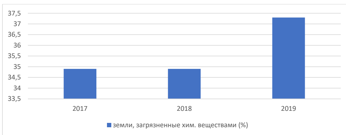
Рис. 4. Диаграмма выявления земель сельскохозяйственного назначения, загрязненных химическими веществами, от количества обследуемых по годам

Анализ данных государственного мониторинга территорий показывает, что качество территорий сельскохозяйственного назначения в Красноярском крае продолжает подвергаться деградации, загрязнению и захламлению. Согласно статье 3 закона № 7-ФЗ «Об охране окружающей природной среды» к основным принципам охраны окружающей среды является обязательность участия органов государственной власти Российской Федерации, органов государственной власти субъектов Российской Федерации, органов местного самоуправления, общественных объединений и некоммерческих организаций, юридических и физических лиц [6]. Вероятно, вследствие недостаточно проработанного в законодательстве механизма повышения ответственности как предприятий, так и народонаселения за нарушения данного закона, ситуация с землями сельхозназначения в Красноярском крае продолжает оставаться напряженной.