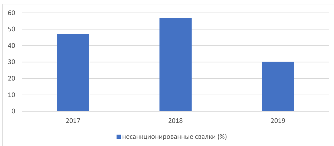
Рис. 1. Диаграмма выявления несанкционированных свалок по годам

В 2017 году в Красноярском крае в рамках контрольно-надзорных мероприятий было обследовано 260,8 тыс. га. территорий сельскохозяйственного назначения (рис. 2). Из них на площади 44,3 тыс. га. были выявлены нарушения требований земельного законодательства Российской Федерации в части использования и охраны земель [2]. В 2018 году было обследовано 110,9 тыс. га. земель сельскохозяйственного назначения, на 73,0 тыс. га. были выявлены нарушения требований земельного законодательства Российской Федерации [3]. В 2019 году в рамках все тех же мероприятий было проверено 103,78 тыс. га сельхозземель, из которых на 72,58 тыс. га нарушены требования земельного законодательства Российской Федерации [4].