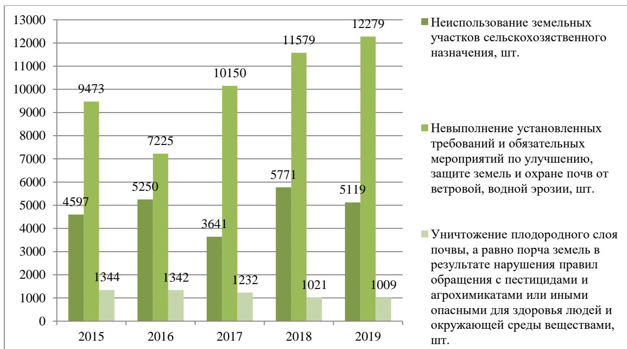
Рис. 2. Количество правонарушений в области использования земельных участков сельскохозяйственного назначения

Увеличение доходности производства продукции сельского хозяйства является ключевым условием для расширенного воспроизводства и важнейшим фактором повышения инвестиционной привлекательности отрасли. Активный ввод в оборот земель сельскохозяйственного назначения будет способствовать появлению новых рабочих мест для жителей сельской местности, увеличению налогооблагаемой базы и существенному росту производимой продукции аграрного сектора.