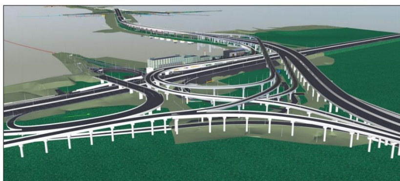
Рис. 2. Проект Северного дублера Кутузовского проспекта

В производственной деятельности дорожных организаций на данный момент существуют лишь единичные проекты создания информационных моделей автомобильных дорог. Так в 2015 и 2019 годах было разработано и завершено 2 проекта с использованием ПО Autodesk. Проект 2015 года был разработан ГК «Моспроект-3» на условиях государственного частного партнерства. Объектом стал Северный дублер Кутузовского проспекта от Молодогвардейской транспортной развязки до ММДЦ (рис. 2) [5].