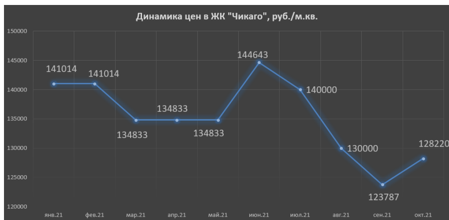
Рис. 4. Динамика цен в ЖК «Чикаго»