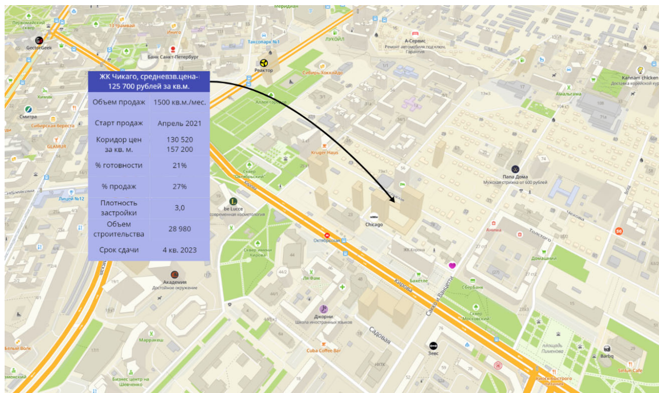
Рис. 3. Характеристика исследуемого ЖК