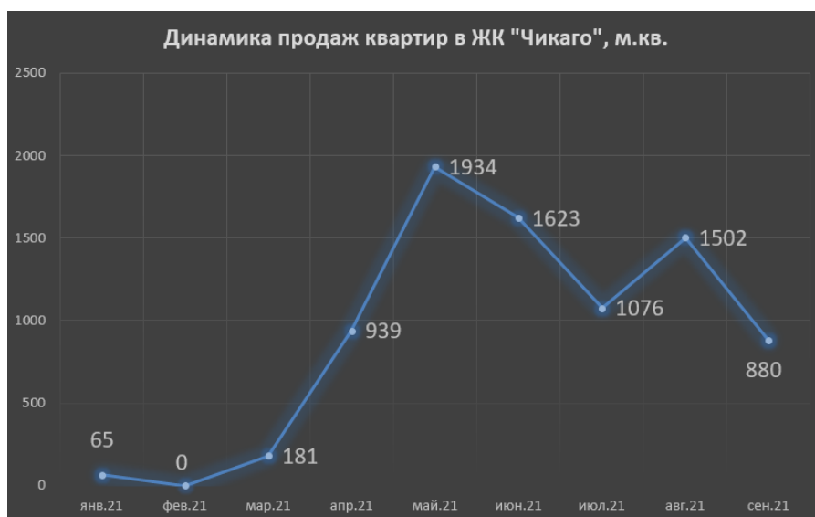
Рис. 5. Динамика продаж жилых помещений в ЖК «Чикаго»

Таким образом, проанализировав основные экономические и маркетинговые показатели ЖК «Чикаго», можно сделать вывод, о том, что концепция данного жилого комплекса идеально подходит для выбранной локации. Среди особенностей формирования ценовой политики ЖК «Чикаго», можно выделить тот факт, что применяются динамично растущие цены с осознанным пониманием того, что покупатель готов платить за квартиры и машиноместа в жилом доме класса «Бизнес».