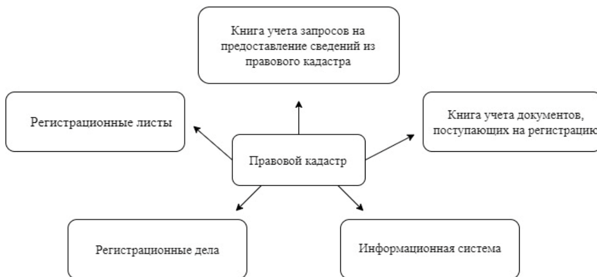
Рисунок 1 – Разделы правового кадастра

Правой кадастр - это единый государственный реестр зарегистрированных прав или же обременений прав на ОН. Правовой кадастр содержит сведения о действующих и прекращенных правах на ОН, о различных характеристиках объекта, о правообладателях таких ОН, и ведется регистрирующими органами. Правовой кадастр содержит все записи о каждом ОН и приравненных к ним объектам, которым присваиваются кадастровые номера. Согласно [3], правовой кадастр состоит из разделов, представленных на рис. 1.