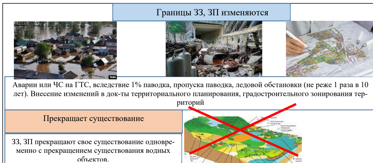
Рис.1. Основания изменения границ ЗЗ, ЗП

Границы ЗЗ, ЗП подлежат согласованию. Изменяются границы зон затопления, по следующим основаниям, рис.1 [5].