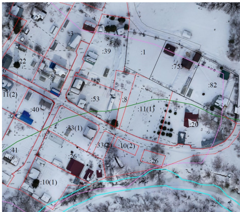
Рис. 2. Фрагмент графической части карта-плана территории

Исполнитель кадастровых работ (кадастровый инженер) проводит необходимые замеры, разрабатывает карту-план территории (рис. 3) и предоставляет его заказчику. После чего карта-план территории направляется на согласование в согласительную комиссию.